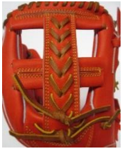
T B 2