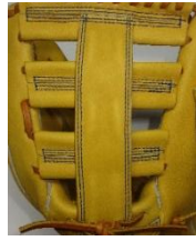
W T B