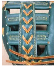
W T B 2