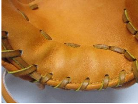
ヨコトジシングル